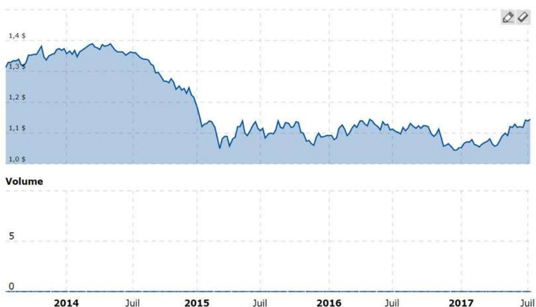
Graphique présentant la variation de la parité euro-dollar pendant la durée du projet, de 2014 à juin 2017

Grâce à cette méthode le risque de change est limité aux variations existant pendant la durée de d'exécution de chaque tranche de subvention, plutôt que pendant toute la durée du projet.